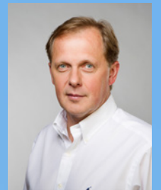
Petr Dvořák generální ředitel České televize

Již dnes Česká televize nabízí bezmála dvě hodiny regionálního zpravodajství denně, a to v kontinuálním vysílání Čtyřicetky, v hlavní zpravodajské relaci Události nebo právě v tematických pořadech. Díky rozšíření pořadu Události v regionech o dvě nové verze můžeme naše diváky informovat o politickém, sportovním i kulturním dění v jejich bezprostředním okolí ještě ve větším detailu než doposud – tak, jako žádná jiná televize v zemi.