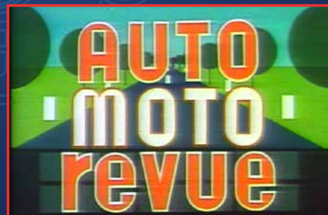
Logo pořadu na začátku devadesátých let