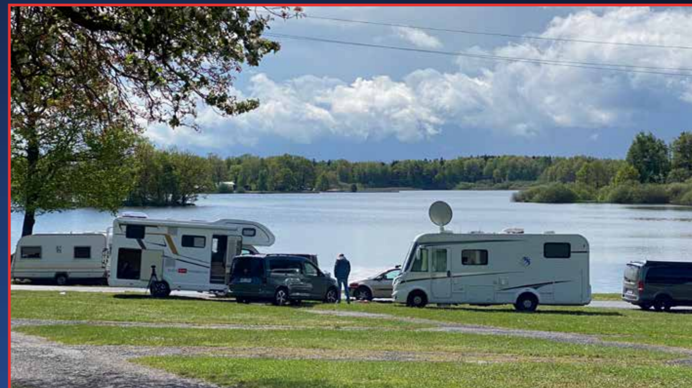
Je na rodinnou dovolenou vhodnější malá dodávka, obytný vůz z půjčovny, nebo cestování po vzoru Marca Pola?

Jak už jsem zmiňoval, jsme národ autíčkářů, a ať už se jedná o mladého kluka, nebo holku, věřím, že tam něco generačně zůstává a v krvi tenhle pozitivní přístup pořád koluje. Věřím tomu, jinak bychom do toho ani nešli. Navíc pořad bude poskytovat i určitou osvětu, protože některá témata se dotýkají i těch, kteří nejsou motoristy. I chodci jsou součástí silničního provozu.