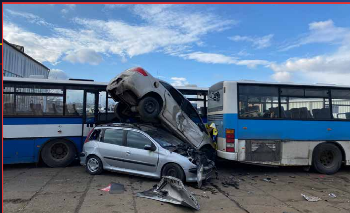
Podobně zaparkujete, když do vás například zezadu najede autobus rychlostí třiceti kilometrů za hodinu