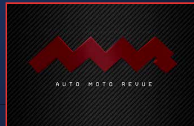
...a logo pořadu o deset let později