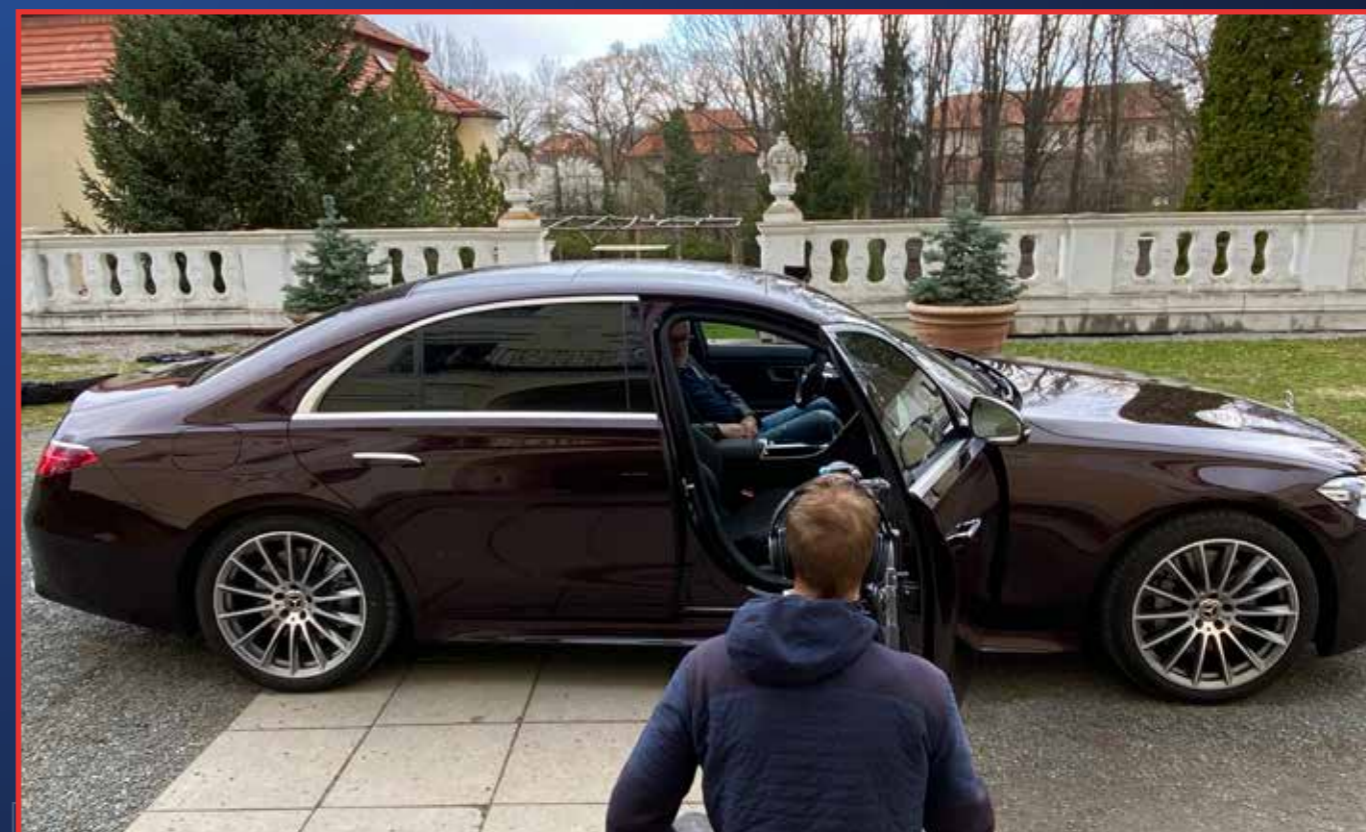
Hodnotit budou redaktoři i luxusní limuzíny

Je to velká výzva. U nových aut je to navíc problém, kdy řešíte, co divákovi nabídnout. Protože novinka ze středního segmentu je pro automobilku zásadní model. A takových novinek je tu najednou spousta. Za těch pět až sedm minut reportáže toho moc říct nestihnete. Aby měla informace hlavu a patu a ne aby se jednalo jen o nudné konstatování technických dat – toho se chceme rozhodně vyvarovat. Vždycky se budeme snažit dostat do příspěvku reálnou osobní zkušenost.