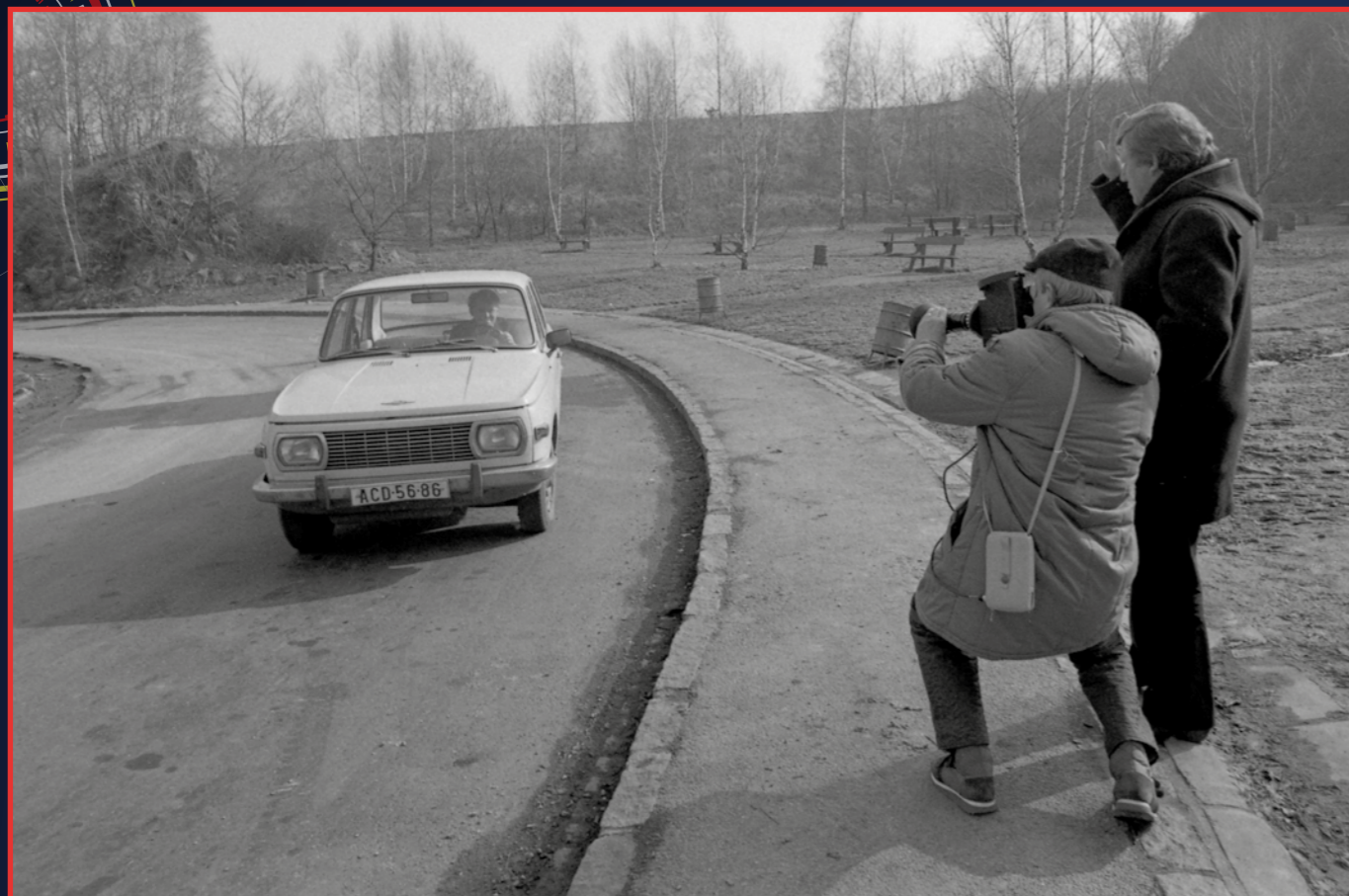
Natáčení motoristického pořadu před sedmatřiceti lety