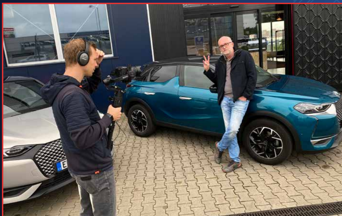
...a natáčení dnes