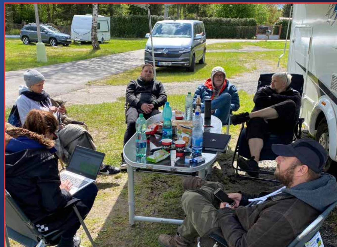
Důležitá porada přes začátek natáčení