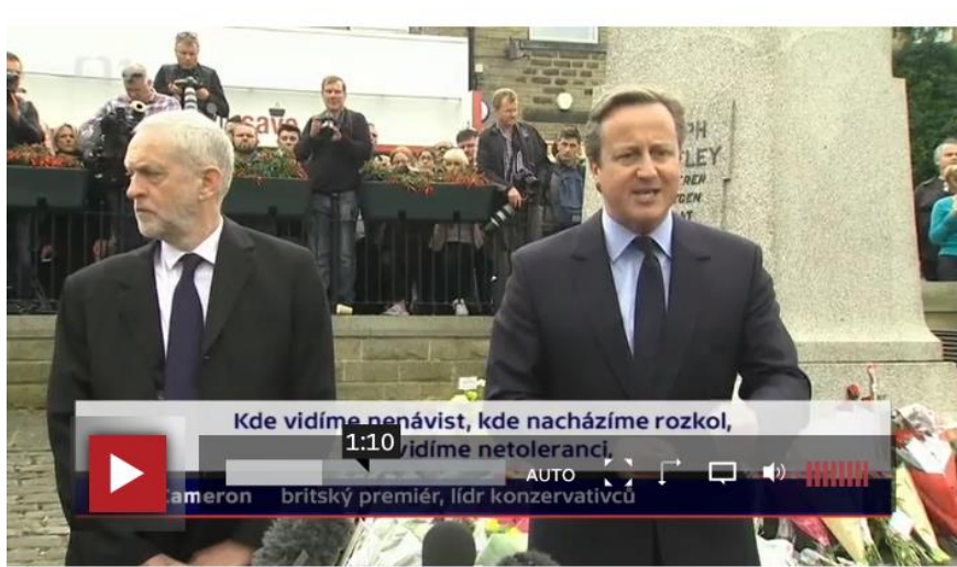
Obr. 5 Po vraždě labouristické poslankyně Coxové politici jednotně odmítli násilí.

britských poslanců a také kritiku vyhocenosti kampaně ( „ kampaň před referendem byla čím dál osobnější a vyhocenější... “, 17. 6.). V auditivní i vizuální stopě je po několik dní akcentována „ jednota proti násilí “.