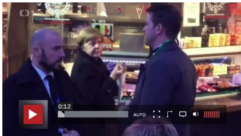
Obr. 1. Neočekávané vizualizace jednání Cameron – EU byly výjimečné.

Jednání EU s Cameronem byla vizualizována tradičními narativními postupy: záběry na jednající politiky v jednacích sálech Evropské unie, ilustrativní prostředí na Londýn, případně uspěchaný Cameron poskytující rozhovor novinářům. Znatelnější změna vizualizace se objevuje až při protahujících se jednáních - například odlehčujícím zachycením Angely Merkelové v bufetu.