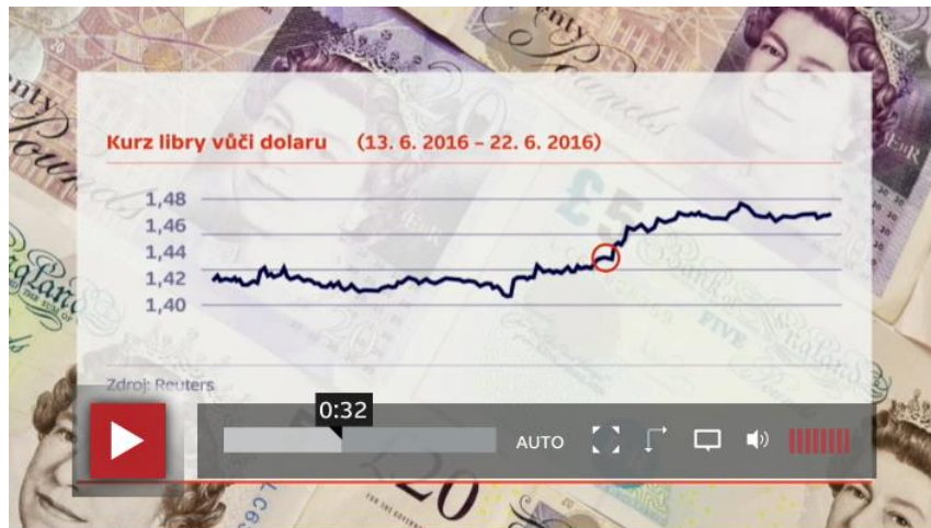
Obr. 8. Ekonomický rámec je jedním z nejsilnějších zarámování.

Překvapivým a novým zarámováním samotného volebního dne se stává překvapivě deštivé počasí a jeho vliv na volební účast. Samotné výsledky referenda jsou ve vysílání spojovány téměř výhradně s negativními (a často apokalyptickými) označujícími, jako „ zemětřesení ve Británii “ a informacemi o negativních ekonomických důsledcích („ Libra se prudce propadla... “).