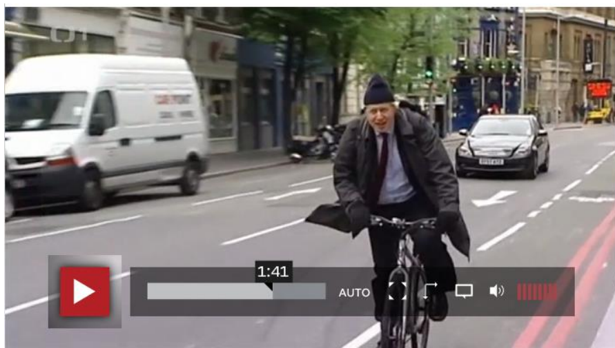
Obr. 3 Vizualizace Borise Johnsona se konotativně výrazněji odlišovala od vizualizace dalších klíčových aktérů.

Z hlediska vizualizace hlavních aktérů referenda nejvíce vybočuje reprezentace Borise Johnsona , který je vizualizován jako nonkonformní, rozháraný politik (v komicky vyhlížející čepici jede na kole), opakuje se jeho jazykové označení z britského tisku - „ blond'atá bomba “ (ČT označení jen přebírá). David Cameron je naopak vizuálně reprezentován jako seriózní, upravený politik, někdy unavený.