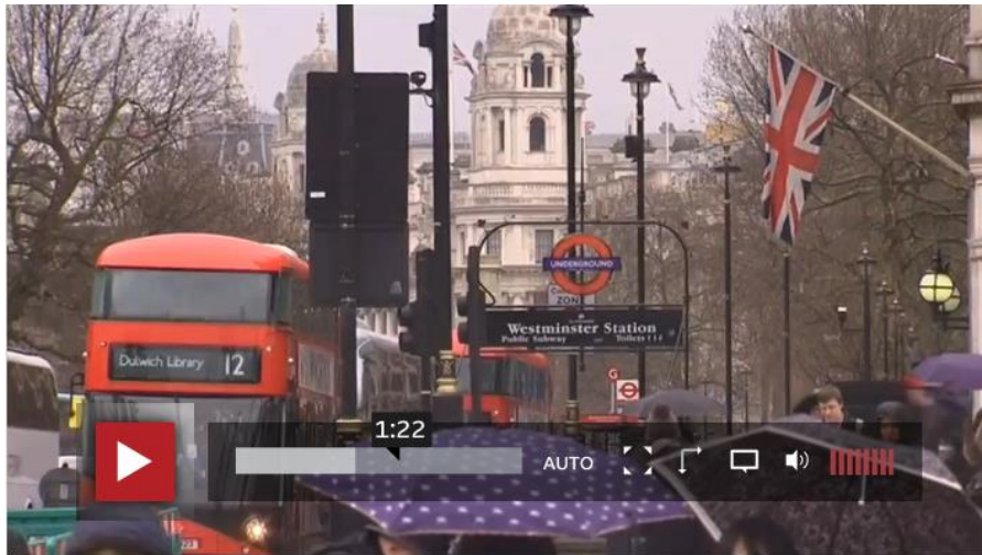
Obr. 2. V souvislosti s Brexitem se opakovaně objevují zaběhlé vizuální metafory.

Z hlediska vizualizace hlavních aktérů referenda nejvíce vybočuje reprezentace Borise Johnsona , který je vizualizován jako nonkonformní, rozháraný politik (v komicky vyhlížející čepici jede na kole), opakuje se jeho jazykové označení z britského tisku - „ blond'atá bomba “ (ČT označení jen přebírá). David Cameron je naopak vizuálně reprezentován jako seriózní, upravený politik, někdy unavený.