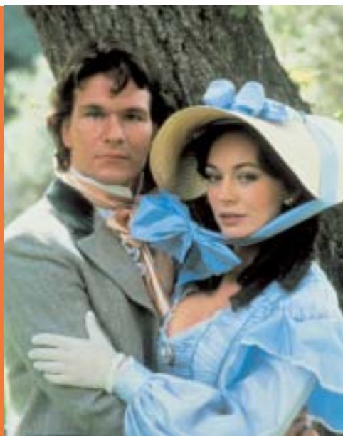
► Sever a Jih