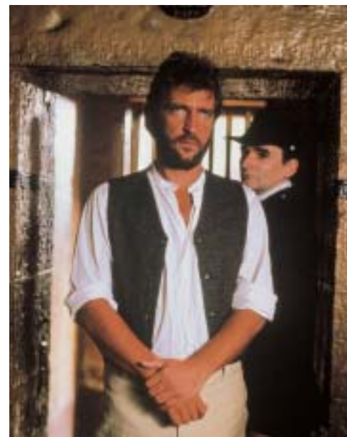
► Co přináší řeka