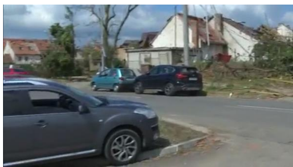
navzájem si pomáhají a přijeli sem přátelé ...

V obecných intencích kvantitativní ani kvalitativní části analýzy až na proporcionálně zanedbatelné výjimky neidentifikovaly signifikantní momenty, které by bylo možno vnímat jako nekonzistentní s požadavky vyplývajících z legislativního a etického rámce fungování médií veřejné služby. Výsledná podoba zpravodajského pokrytí události „tornádo 2021“ v rámci daného období napříč všemi analyzovanými pořady představovala relativně komplexní a mnohohvrstevnatou reprezentaci pokrývající podstatné aspekty, roviny a charakteristiky této události. Současně byla charakteristická vysokým podílem výpovědí relevantních (extramediálních, tedy nikoliv jen reportérů, redaktorů) mluvčích, stejně jako značným podílem autentických výpovědí „přímých aktérů“ události, což posiluje výsledný dojem