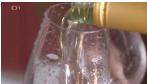
REP: Proto když znavené lidi