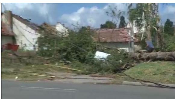
Zatím nemají kam dávat, místní říkali, že zatím čekají na kontejnery,