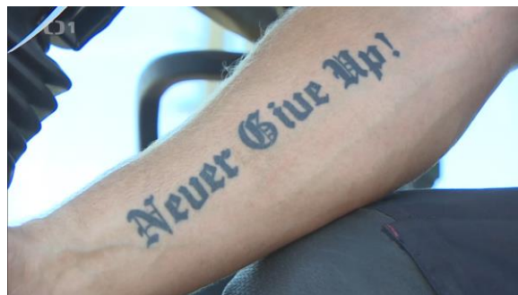
Never give up – nikdy se nevzdávej. Barbora Blažková, Česká televize.