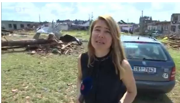
že budou muset k zemi. Některým chybí jen střechy. Když se podívám kolem sebe vidím