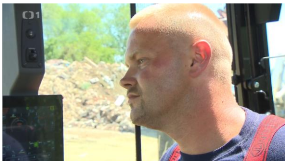
heslem, které má vytetované na předloktí