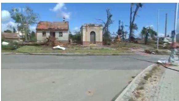
Vůbec nespali a už teď se tu ozývají motorové pily a dunění