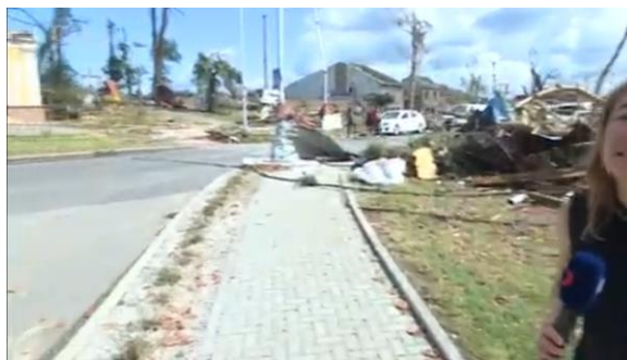
lidi v plné práci, někteří z nich