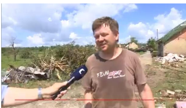
AKTÉR 1: Nejdůležitější je, že nám zůstalo víno ve sklepech a je v pořádku.