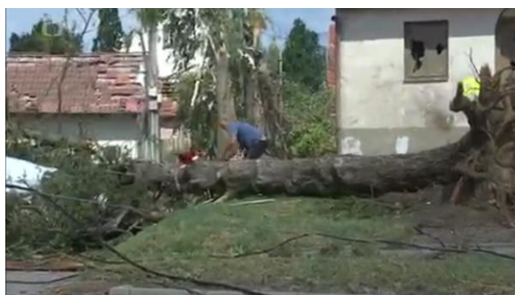
jak shazují ze střech tašky a taky suť, trámy, cihly, dřevo je poházené všude kolem. Suť přitom