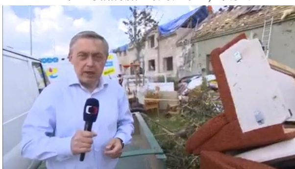
REP: Snad z každého domu se tady v Mikulčicích ozývá stavební ruch, jakoby všichni místní vzkazovali, tornádo nás nedostane