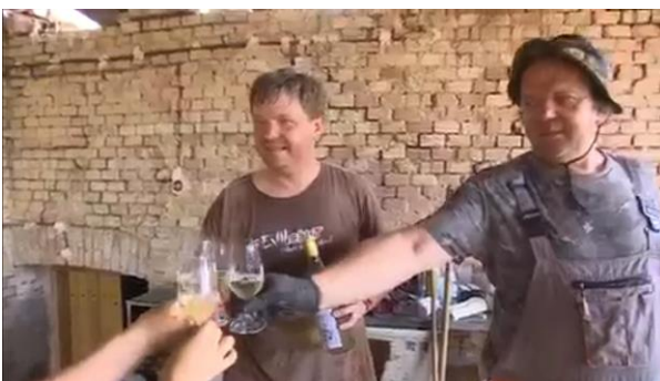
hned nepřemůže spánek, i na sklenku dojde.