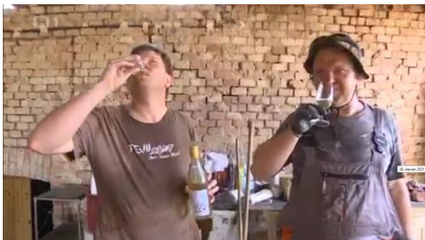
AKTÉR 2: Ať se nám to všechno brzo vrátí zpátky