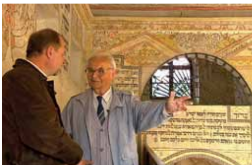
Protože Židé neměli knížky a texty z paměti neznali, jsou texty modliteb na stěnách.