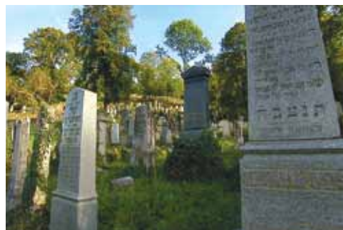
Boskovický židovský hřbitov patří k největším u nás.

Pak mě můj průvodce vede po schodech do vedlejší lodi, která je mladší. Byla přistavěna později: „Zajímavá je zde neobyčejně živá a bohatá výmalba stěn,“ říká. „Zahrnuje nápisová pole, spirálové vegetabilní rozviliny, hvězdovité květy, symbolická zpodobení zvířat a ptáků, ale i Desatero s Korunou tóry. Tato část malované výzdoby boskovické synagogy patří k nepůsobivějším.“ Je to tak.