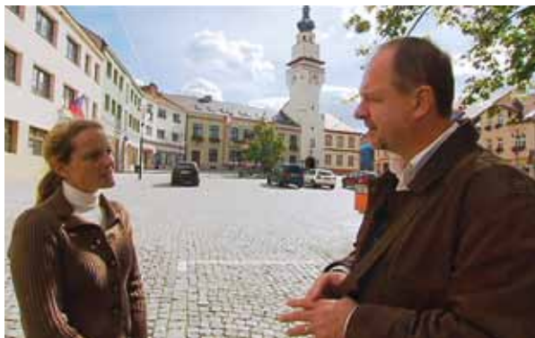
Dnešní Masarykovo náměstí je vlastně historický rynek města Boskovice.

Pak s muzejnicí vyrazím na procházku po starobylém městě. Jdeme z kopečka a po pár desítkách metrů přicházíme na Masarykovo náměstí, což je vlastně historický rynek města Boskovice.