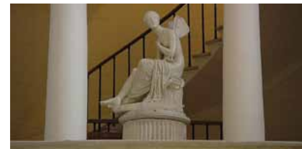
Vstupní hala boskovického zámku je ozdobena antikizujícími sochami.