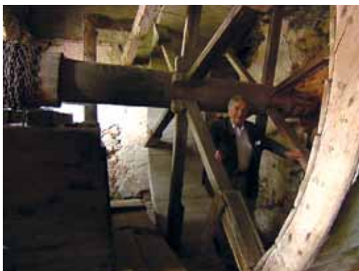
Toto kolo je jediné funkční v celé republice.

dřevěné nádoby, potom se člověk obrátil, šlapal na druhou stranu a tahal tu druhou nádobu.“