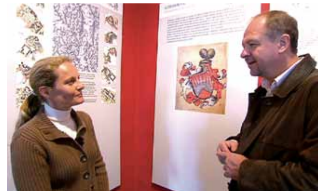
Víte, proč má dnes město, stejně jako rod Boskoviců, v erbu sedmizubý hřeben?

hraběcí rodina Dietrichsteinů, a to z materiálu získaného bouráním zdiva na boskovickém hradě. Rezidence sloužila jako sídlo majitelů panství až do postavení nového boskovického zámku. Pak tu byly lesní správa, správa panství a v pozdější době třeba i byty.“