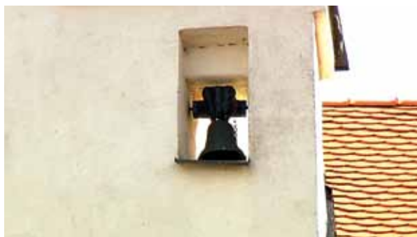
Tak zvaným pírglokem oznamoval obecní sluha třeba konec šenkování v měšťánských domech.

„Původně to ale byl kupecký dům,“ upozorňuje mě muzejnice, „u kterého bylo i skladiště, postavené ze dřeva hned vedle věže, tak zvaný špýchar, tedy sýpka, kam cizí kupci ukládali své zboží. A zajímavý je také zvonek z roku 1593 na průčelí radniční budovy. Říkalo se mu pírglok. Je takový nenápadný, ale ve své době měl veliký význam.“