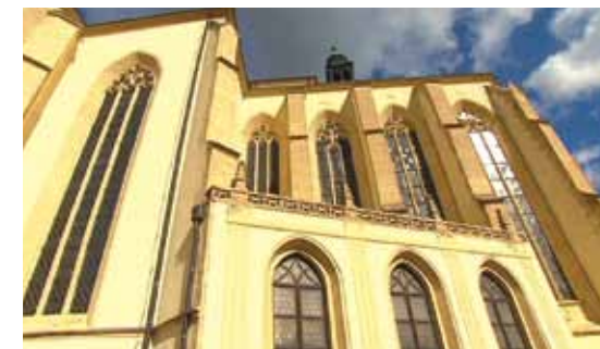
Kostel svatého Jakuba Staršího prošel zásadní přestavbou právě za pánů z Boskovic.

Je zajímavé, že až do doby josefínské, do roku 1786, se u kostela i pohřbívalo. Ale spočinout tu mohli jen rynkovní měšťané a vrchnostenská úředníci!