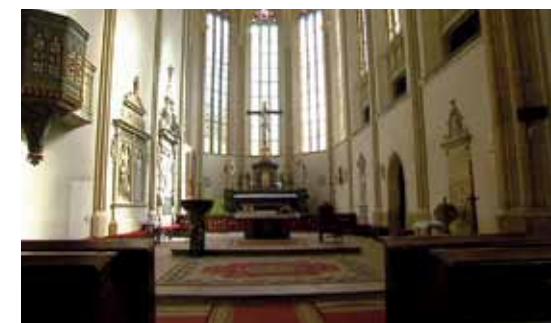
Kostelní lavice pocházejí z dominikánského kláštera, který stával v místech dnešního zámku.