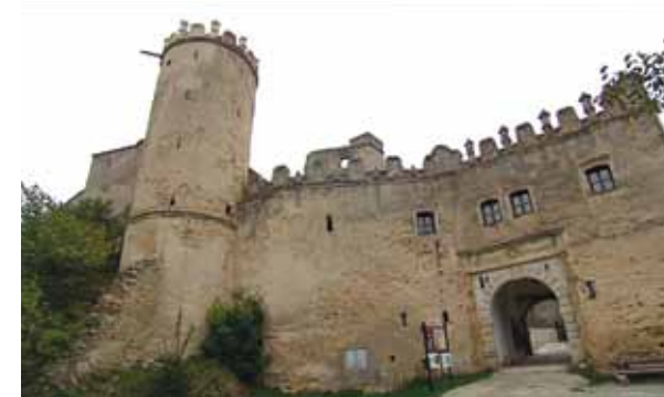
Do našich dnů se uchovaly pozůstatky někdejšího paláce s renesanční hláskou a bránou do hradu.

„To sloužilo k vytahování džberů s vodou,“ říká usměvavý pán, a než se stačím nabídnout, sám se proplétá mezi trámy a vstupuje do kola, kde mi předvádí: „Takto se šlapalo, kolo se otáčelo a tahalo džber ze dna studny. A protože tam byly dvě