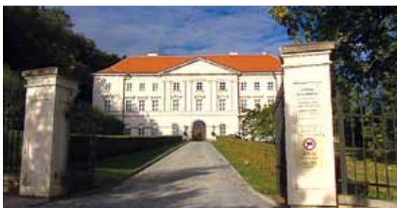
Boskovický zámek má okázalé a elegantní klasicistní průčelí.

Boskovický zámek má okázalé a elegantní klasicistní průčelí – a je to vlastně bývalá manufaktura! Víím to, a stejně neumím odpovědět, když se mě zámecký pán ptá, co to je za železné koule, které chrání rohy po stranách vrat do zámeckého průjezdu.