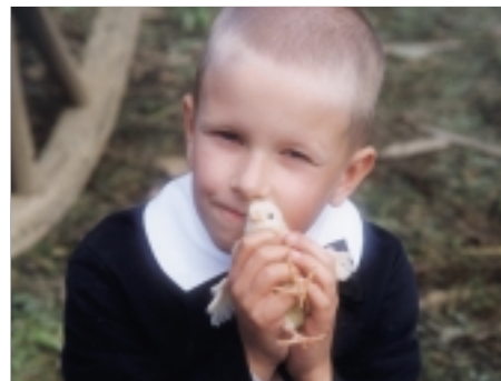
42. Kuře melancholik Melancholic Chicken 1999