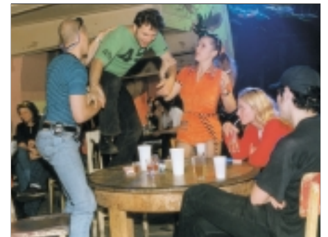
52. Mrtvej brouk Dead Beetle