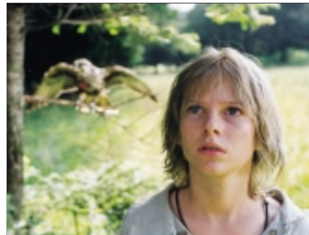
38. Král sokolů The Falcon King 2000