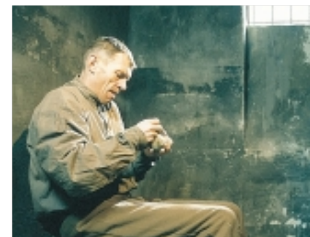
8. Bumerang Boomerang 1996