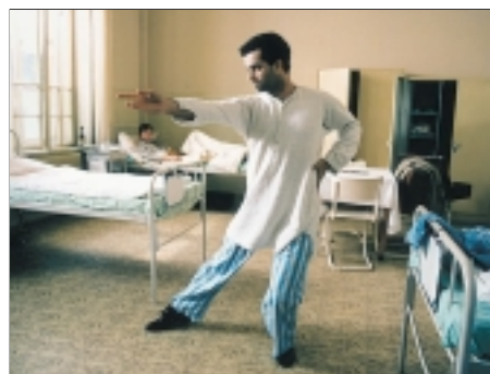
75. Učitel tance The Dance-Master 1994