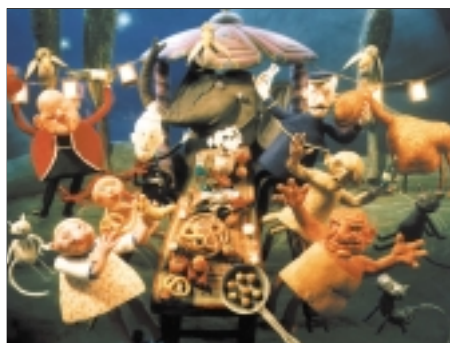
74. Šest statečných The Magnificent Six 2000