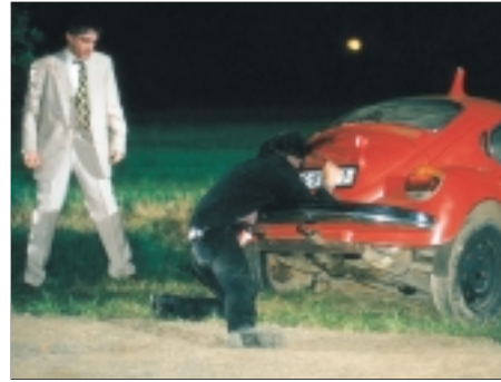
34. Knoflíkaři Buttoners 1997