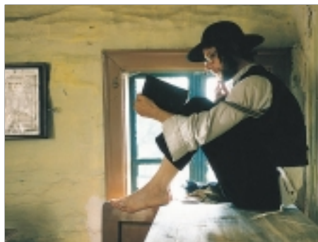
22. Golet v údolí The Golet in the Valley 1995