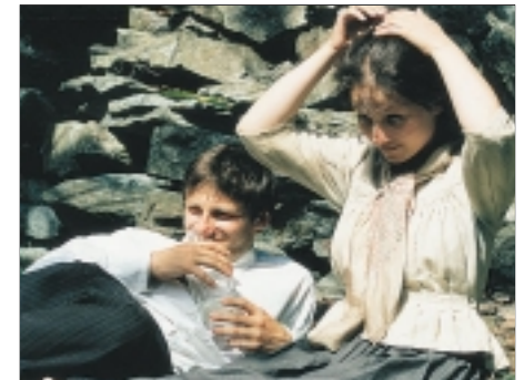
40. Kráva The Cow 1993