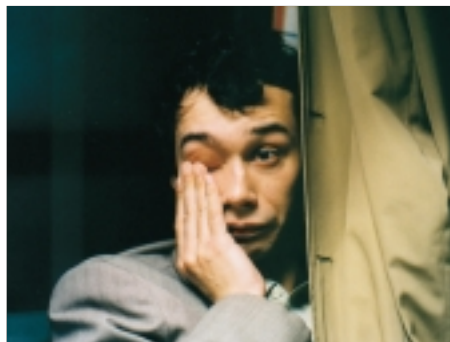
54. Návrat idiota The Return of the Idiot