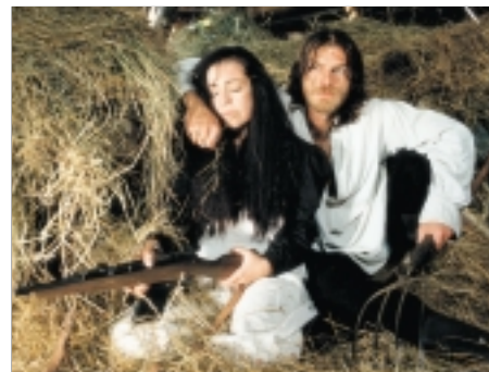
55. Nejasná zpráva o konci světa An Ambiguous Report About the End of the World