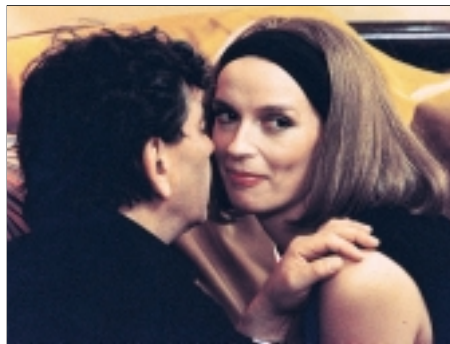
14. Díky za každé nové ráno Thanks for Every New Morning