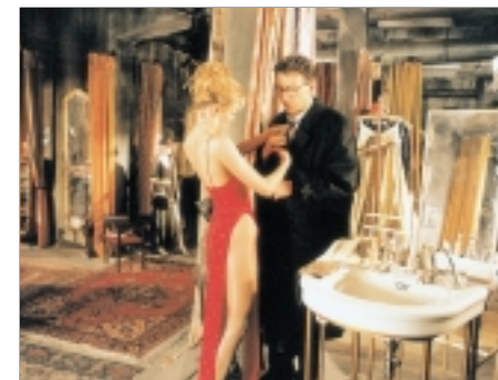
60. Pasáž The Passage 1996