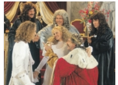
56. Nesmrtelná teta The Immortal Aunt