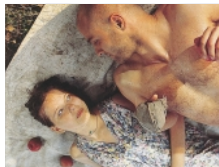
80. Zahrada The Garden 1995