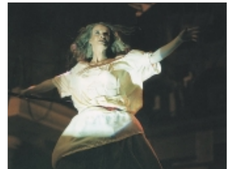
16. Don Gio Don Gio