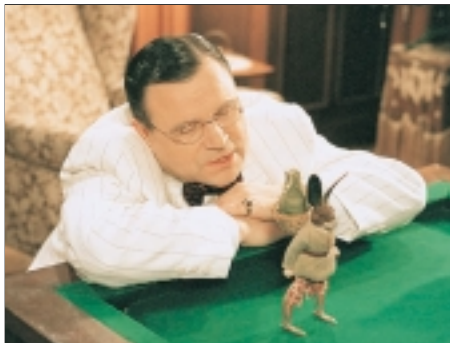
37. Konto separato Conto Separato 1997