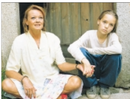
25. Hrad z písku The Sandcastle 1994