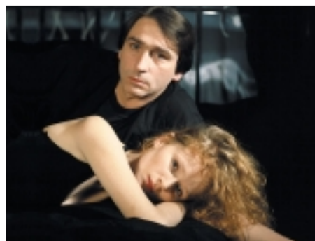
79. Výchova dívek v Čechách Bringing Up Girls in Bohemia 1997