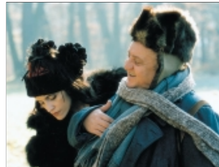
39. Král Ubu King Ubu 1996