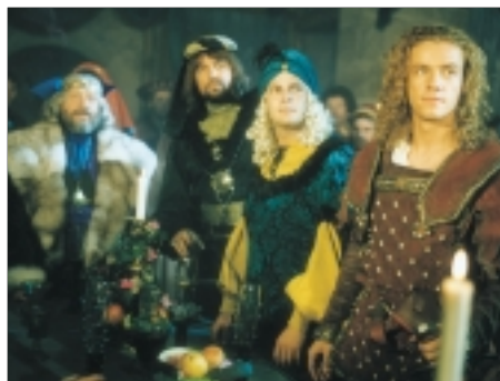
58. O třech rytířích, krásné paní a Iněné kytli Of Three Knights, a Beautiful Lady and a Linen Sark 1996