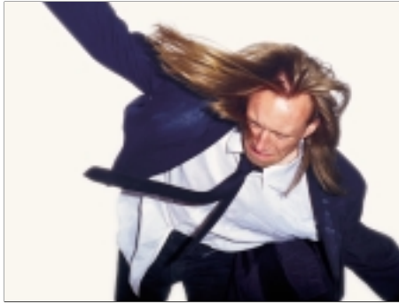
33. Kanárek My Detox 2000