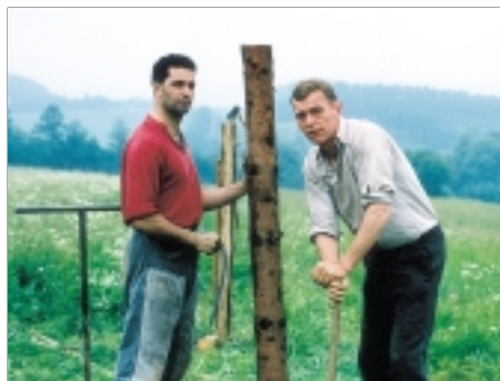
82. Zdivočelá země A Land Gone Wild