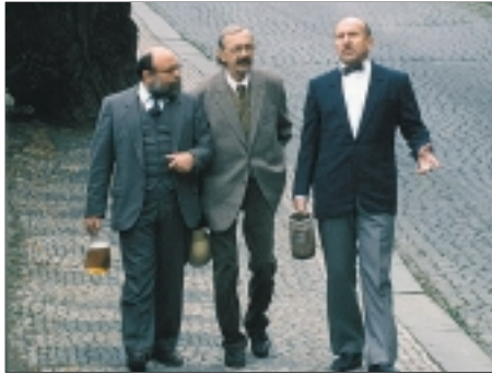
45. Malostranské povídky Humoresques from the Lesser Town of Prague