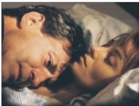
81. Zapomenuté světlo A Forgotten Light