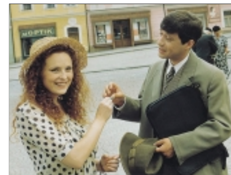
4. Andělské oči Angelic Eyes 1993