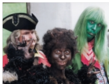
67. Princezna ze mlejna II The Princess from the Mill II 2000