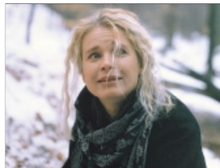
3. Anděl milosrdenství The Angel of Mercy 1994