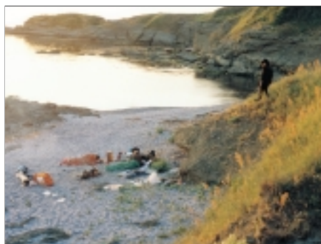
85. Zviditelnění Visualization