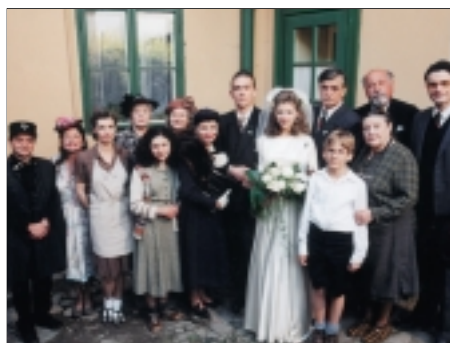
62. Početí mého mladšího bratra The Conception of My Younger Brother 1999