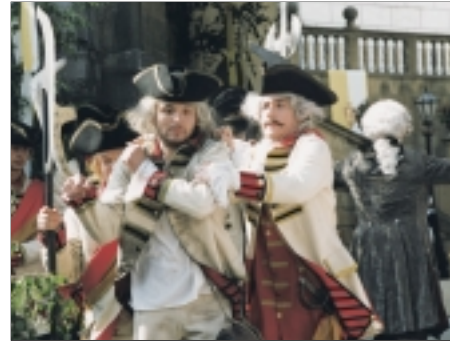
11. Císař a tambor The Emperor and the Drummer