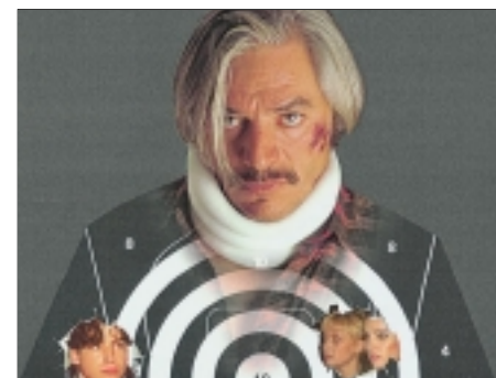
28. Jak chutná smrt The Taste of Death 1995