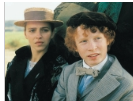
24. Helimadoe Helimadoe 1993