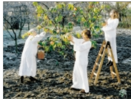
51. Modré z nebe Blue Heaven