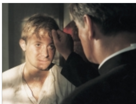
30. Je třeba zabít Sekala Sekal Has to Die 1998