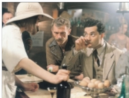
2. Amerika America 1993