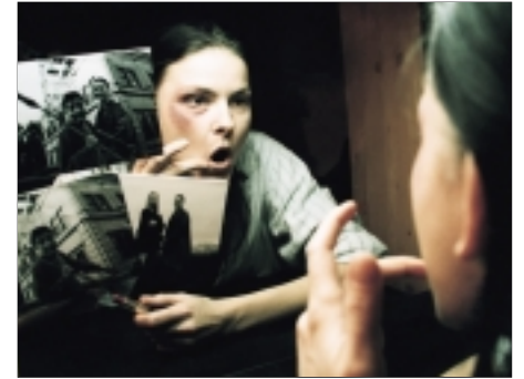
48. Minulost The Past