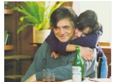
44. Má je pomsta Vengeance Is Mine 1994