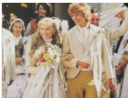
66. Princezna ze mlejna The Princess from the Mill 1994