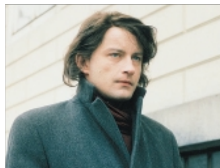
86. Žiletky Razor-Blades