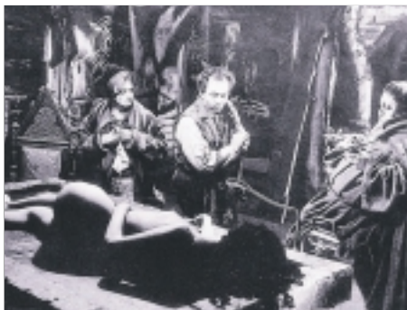
41. Krvavý román A Sanguinary Novel 1992