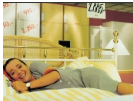
76. Už - Uživej Života Seizing the Day 1996