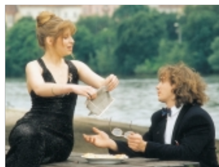
31. Jméno kódu Rubín Code Name Ruby 1996