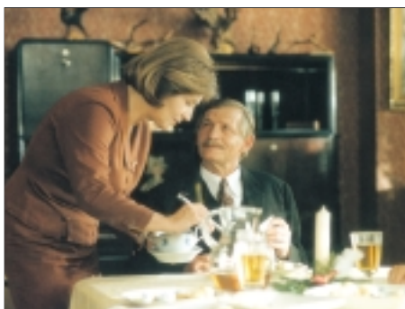
61. Pelišky Cosy Dens 1999