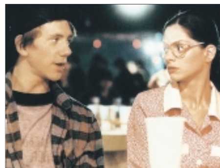
27. Indiánské léto Indian Summer 1995