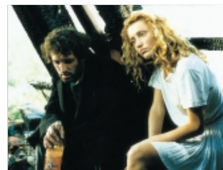
32. Kamenný most The Stone Bridge 1996