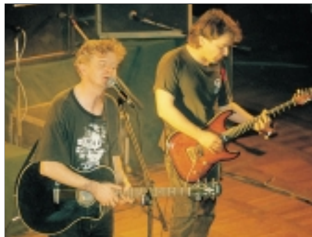
50. Mňága – Happy End Mňága – Happy End