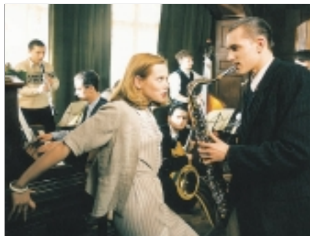
18. Eine kleine Jazzmuzik Just a Little Bit of Jazz