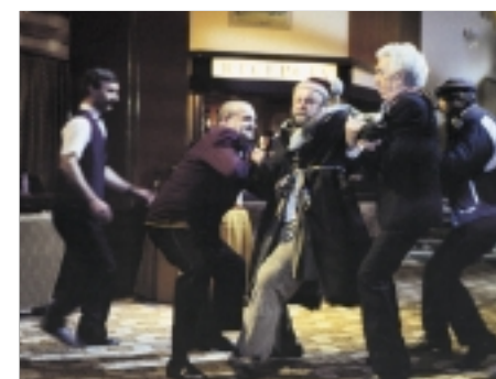
68. Rivers of Babylon Rivers of Babylon 1998