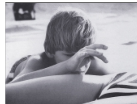
64. Postel The Bed 1998