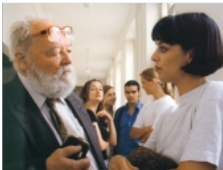
17. Dvojróle Double Role