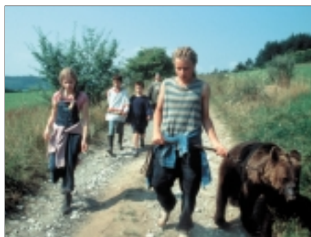
26. Hurá na medvěda Hurrah for Bears 2000