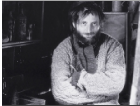
10. Cesta pustým lesem The Way through the Black Woods