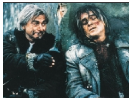
63. Poslední přesun The Final Transfer 1995