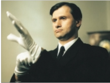
9. Ceremoniář Master of Ceremonies