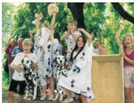
6. Artuš, Merlin a Prchlíci Arthur, Merlin and the Prchliks 1995