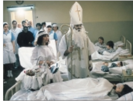
47. Městem chodí Mikuláš St. Nicholas Is in Town