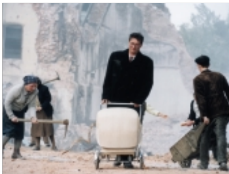
53. Musíme si pomáhat Divided We Fall