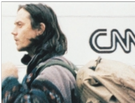
49. Mladí muži poznávají svět Young Men Discovering the World