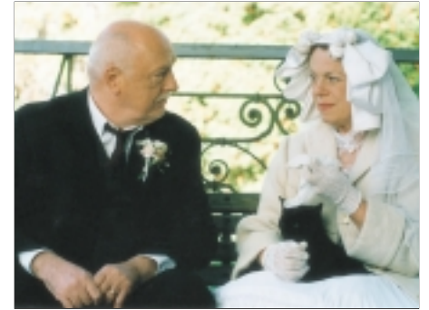
12. Co chytneš v žitě In the Rye