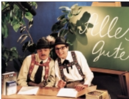
13. Česká soda '98 Czech Soda '98