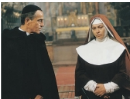
69. Řád The Order 1993