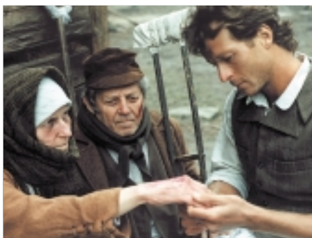
77. Vincenz Priessnitz Vincenz Priessnitz 1999