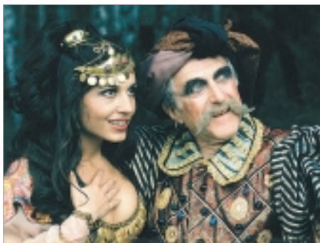
57. O perlové panně The Pearl Maiden 1997