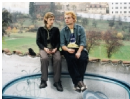
70. Samotáři The Loners 2000