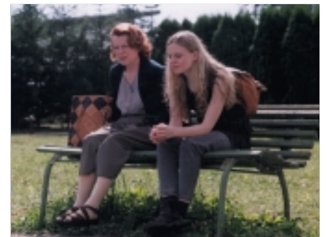
20. Ene bene Eeny Meeny