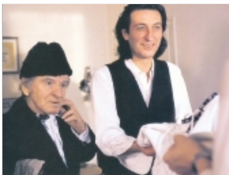
5. ... ani smrt nebere Where Even Death Does Not Apply 1996