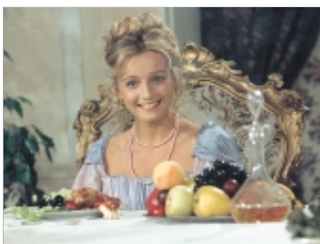
29. Jak si zasloužit princeznu How to Win a Princess 1995