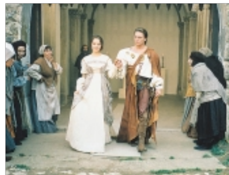
72. Sedmero krkavců Seven Ravens 1993