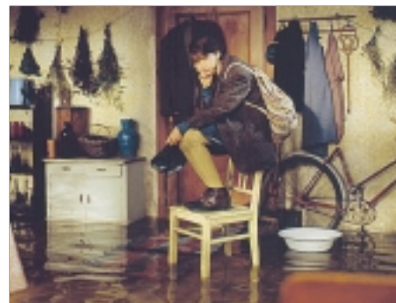
59. Orbis Pictus Orbis Pictus 1997