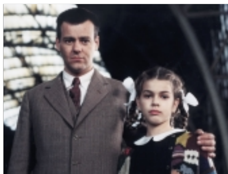
78. Všichni moji blízcí All My Loved Ones 1999