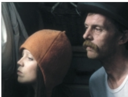
1. Akáty bílé White Acacias 1996