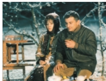
7. Báječná léta pod psa The Wonderful Years That Sucked 1997