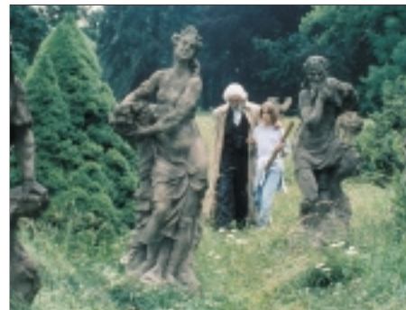
15. Do nebička The Legend of the Ladybird