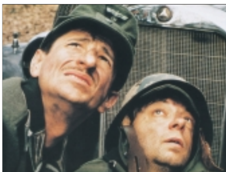
73. Stůj, nebo se netrefím Halt, or I'll Miss 1998