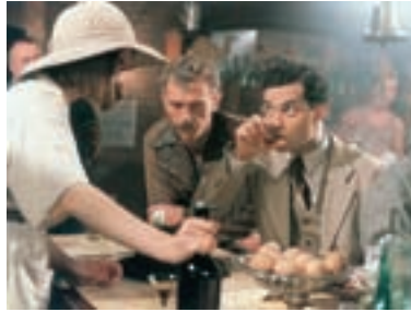
2. Amerika America 1993