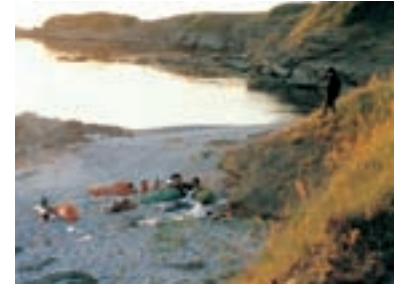
129. Zviditelnění 1997 Visualization