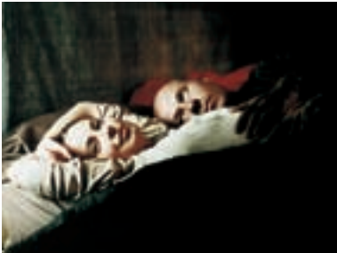
85. Paralelní světy 2001 Parallel Worlds