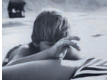
92. Postel The Bed