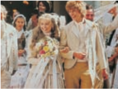
94. Princezna ze mlejna II The Princess from the Mill