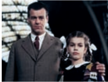
119. Všichni moji blízcí All My Loved Ones 1999