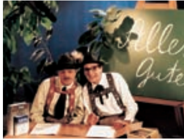
20. Česká soda '98 Czech Soda '98 1998