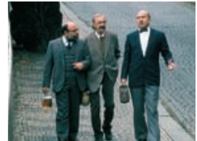
63. Malostranské povídky Humoresques from the Lesser Town of Prague 1995