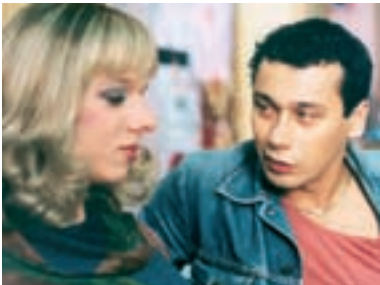
97. Pupendo Pupendo