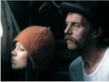
1. Akáty bílé White Acacias 1996