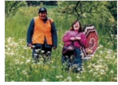
96. Proroci a básníci Prophets and Poets