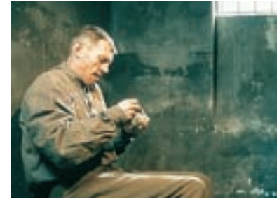
12. Bumerang Boomerang