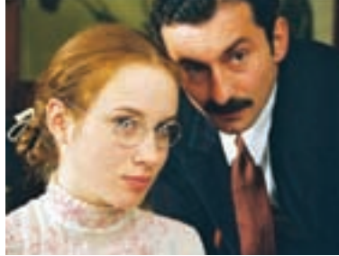
56. Kruté radosti Cruel Joys 2002