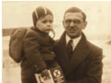
107. Síla lidskosti – Nicholas Winton The Power of Good – Nicholas Winton