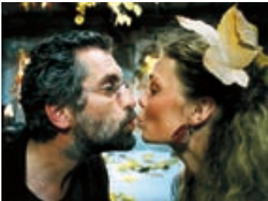
16. Cesta z města Out of the City