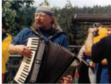
11. Bohemia docta Bohemia Docta