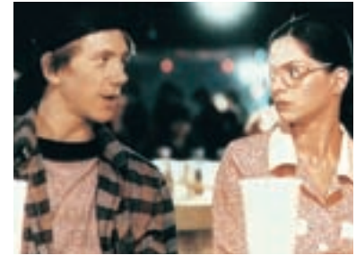
39. Indiánské léto Indian Summer 1995