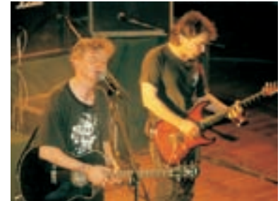
69. Mňága - Happy End Mňága - Happy End 1996