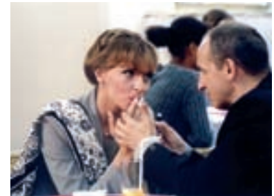
72. Musím tě svěst Seducer 2002