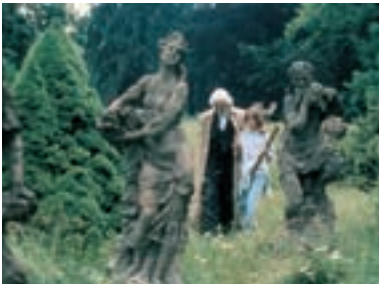
25. Do nebička The Legend of the Ladybird 1997