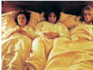
98. Quartétto Quartetto