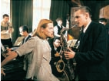
28. Eine kleine Jazzmusik Just a Little Bit of Jazz 1995