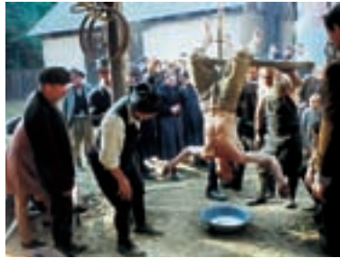
50. Krajinka Landscape 2000