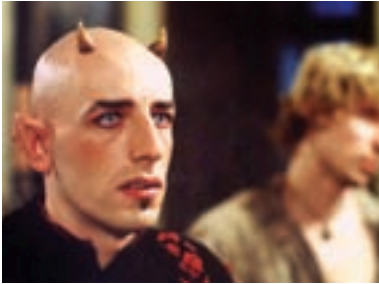
19. Čert ví proč... The Devil Knows Why... 2003