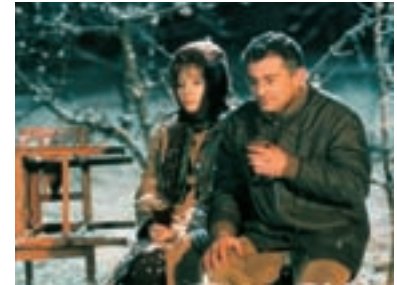
9. Báječná léta pod psa The Wonderful Years That Sucked 1997