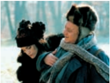
52. Král Ubu King Ubu 1996