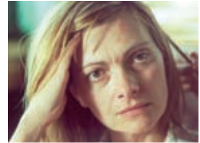
78. Nevěrné hry 2003 Faithless Games