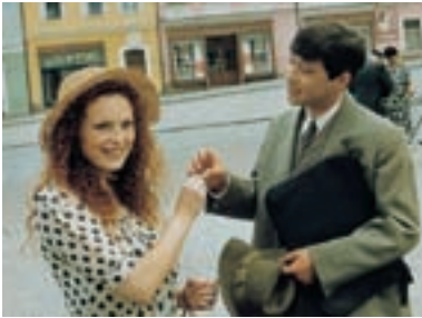
4. Andělské oči Angelic Eyes 1993