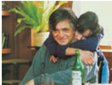
62. Má je pomsta Vengeance Is Mine 1994