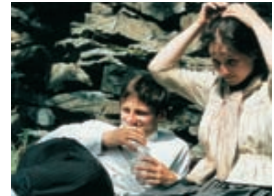
54. Kráva The Cow 1993