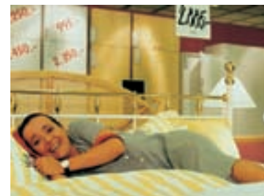
117. Už – Uživej Života Seizing the Day