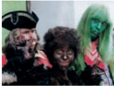
95. Princezna ze mlejna II The Princess from the Mill II