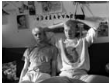
80. Nuda v Brně 2003 Bored in Brno