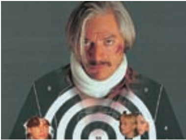
40. Jak chutná smrt The Taste of Death 1995