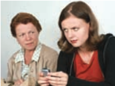
121. Výlet Some Secrets 2002