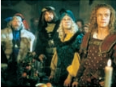
82. O třech rytířích, krásné paní a lněné kytli 1996 Of Three Knights, a Beautiful Lady and a Linen Sark