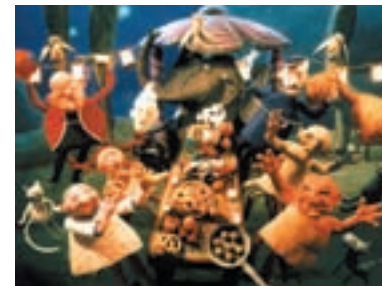
111. Šest statečných The Magnificent Six