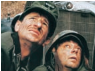
109. Stůj, nebo se netrefím Halt, or I'll Miss