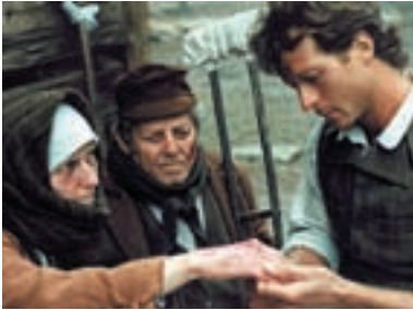
118. Vincenz Priessnitz Vincenz Priessnitz 1999