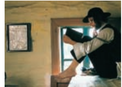
33. Golet v údolí The Golet in the Valley 1995