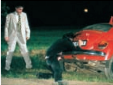
46. Knoflíkaři Buttoners 1997