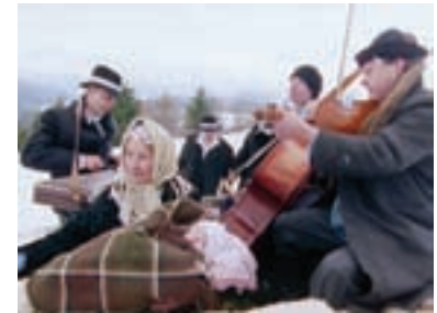
99. Radhošť Radhošť