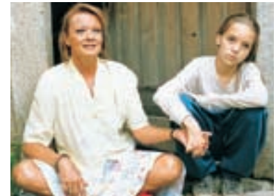
36. Hrad z písku The Sandcastle 1994