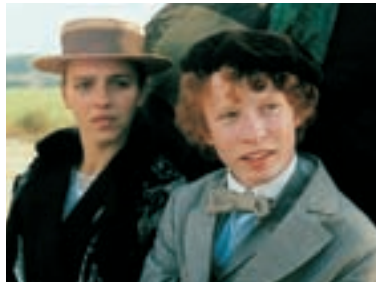
35. Helimadoe Helimadoe 1993