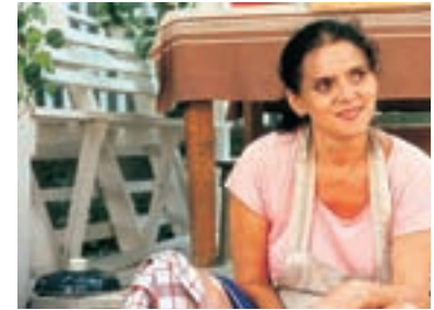
48. ... koně na betoně ...Horses on Concrete 1995