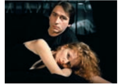
120. Výchova dívek v Čechách Bringing Up Girls in Bohemia 1997