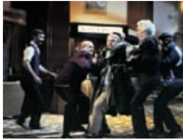
101. Rivers of Babylon Rivers of Babylon