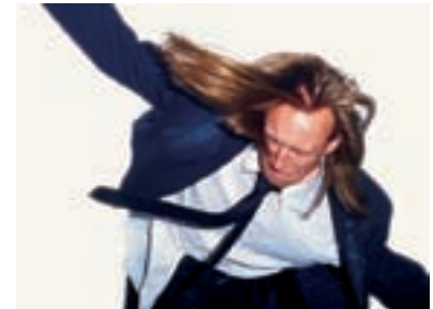
45. Kanárek My Detox 2000