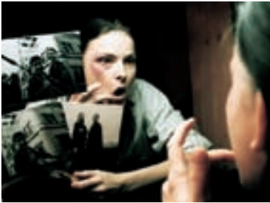
67. Minulost The Past 1999