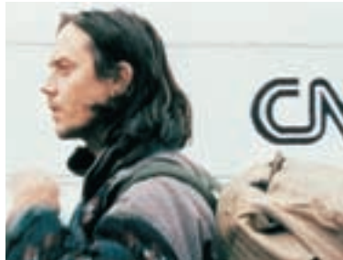
68. Mladí muži poznávají svět Young Men Discovering the World 1996