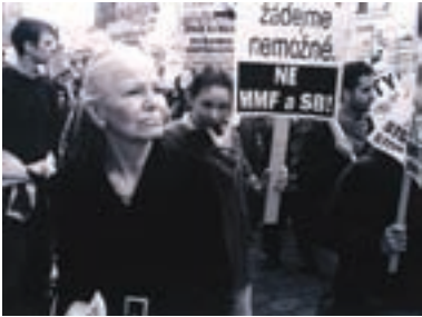
37. Hry prachu Dust Games 2001