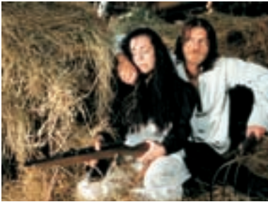
76. Nejasná zpráva o konci světa 1997 An Ambiguous Report About the End of the World