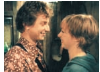
24. Divoké včely The Wild Bees 2001