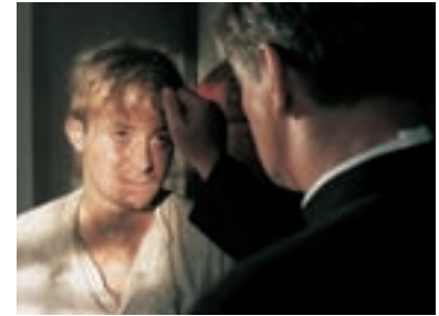
42. Je třeba zabít Sekala Sekal Has to Die 1998