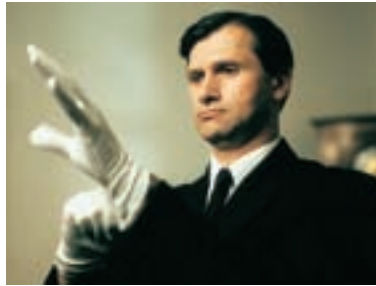
14. Ceremoniář Master of Ceremonies