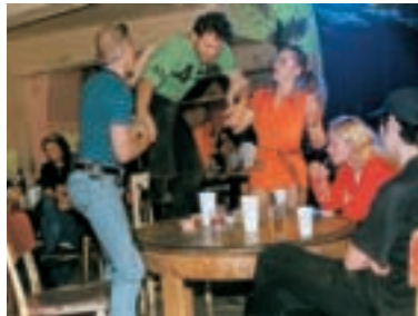
71. Mrtvej brouk Dead Beetle 1998