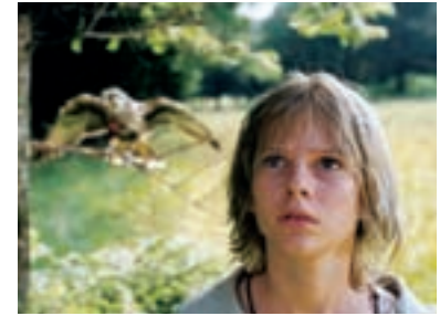
51. Král sokolů The Falcon King 2000