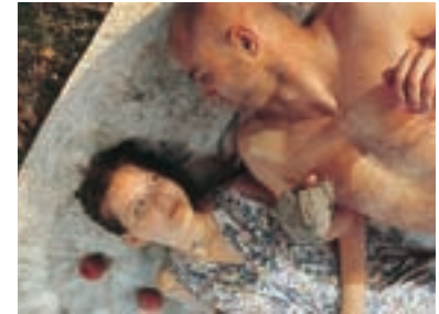
123. Zahrada The Garden 1995