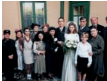
89. Početí mého mladšího bratra 1999 The Conception of My Younger Brother