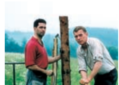
126. Zdivočelá země A Land Gone Wild 1997