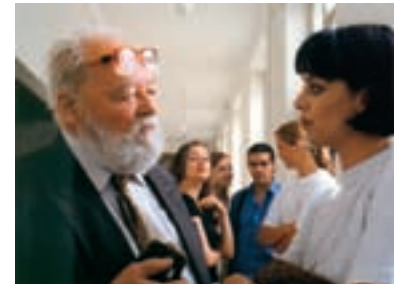
27. Dvojrole Double Role 1999