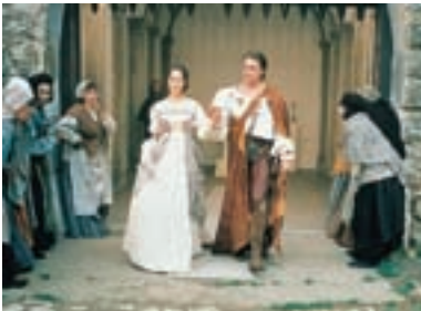
106. Sedmero krkavců Seven Ravens