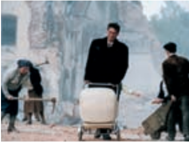
73. Musíme si pomáhat 2000 Divided We Fall