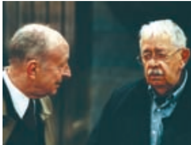
8. Babí léto Autumn Spring 2001