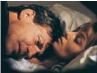
124. Zapomenuté světlo A Forgotten Light 1996