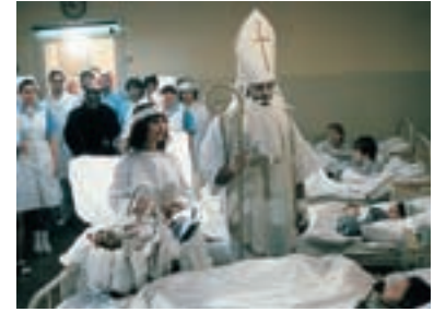
66. Městem chodí Mikuláš St. Nicholas Is in Town 1992