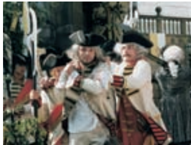
17. Císař a tambor The Emperor and the Drummer