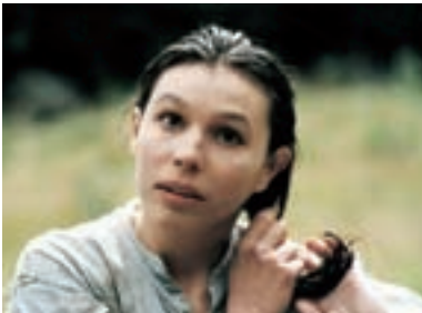
34. Hanele Hanele 1999