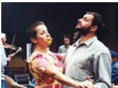
115. Únos domů Kidnapped Home