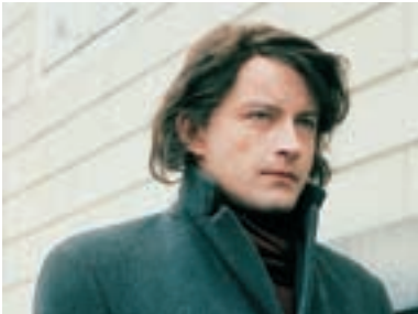
130. Žiletky 1993 Razor-Blades