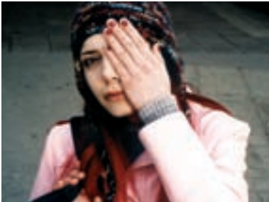
22. Děvčátko Girlie 2002