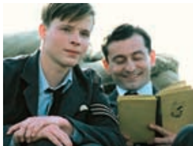
113. Tmavomodrý svět Dark Blue World