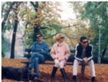
110. Šeptej Whisper