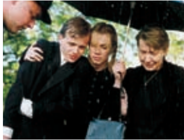
83. Oběti a vrazi 2000 Victims and Murderers