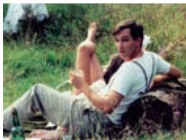
116. Útěk do Budína Escape to Buda