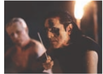
102. Rok ďábla The Year of the Devil