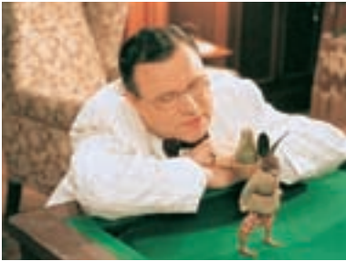
49. Konto separato Conto Separato 1997