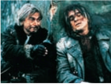
91. Poslední přesun The Final Transfer