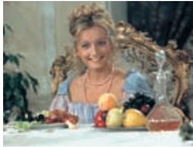
41. Jak si zasloužit princeznu How to Win a Princess 1995