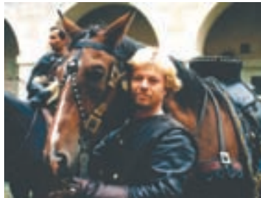
53. Královský slib A Royal Promise 2001