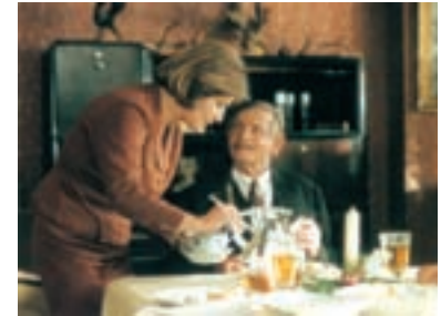
87. Pelíšky 1999 Cosy Dens