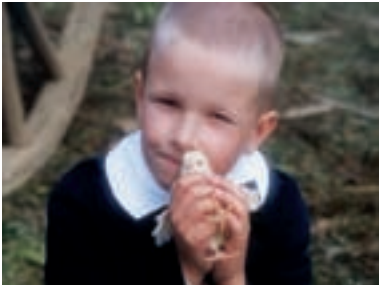
58. Kuře melancholik Melancholic Chicken 1999