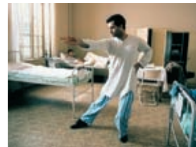
114. Učitel tance The Dance-Master