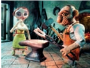
32. Fimfárum Jana Wericha Jan Werich's Fimfárum 2002