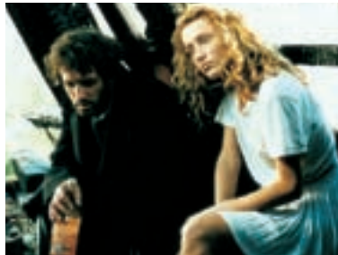
44. Kamenný most The Stone Bridge 1996