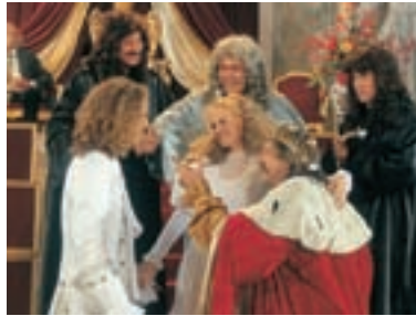
77. Nesmrtelná teta 1993 The Immortal Aunt