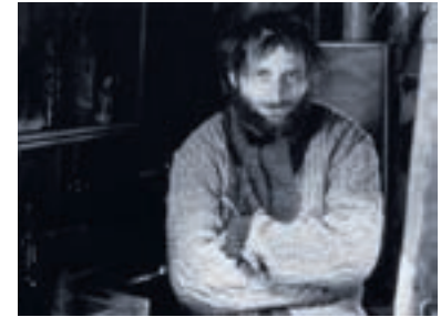
15. Cesta pustým lesem The Way through the Black Woods