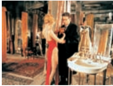
86. Pasáž 1996 The Passage