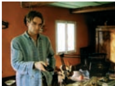
125. Zatracení The Damned 2002