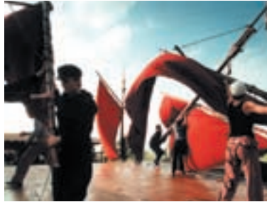
74. Nachové plachty 2001 Crimson Sails