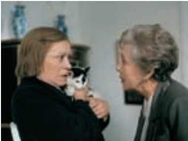
31. Fany Fanny 1995