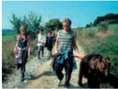
38. Hurá na medvěda Hurrah for Bears 2000