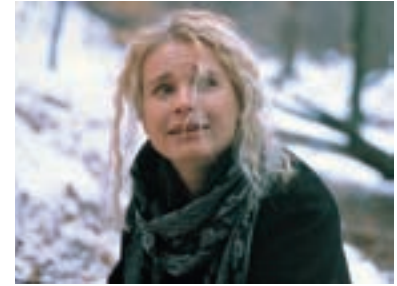
3. Anděl milosrdenství The Angel of Mercy 1994