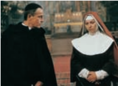
103. Řád The Order