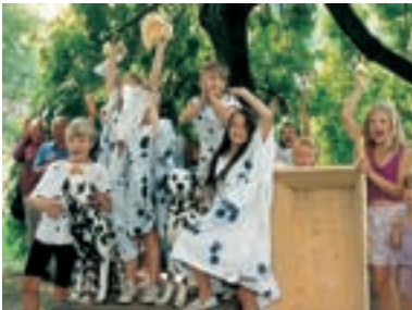
7. Artuš, Merlin a Prchlíci Arthur, Merlin and the Prchliks 1995