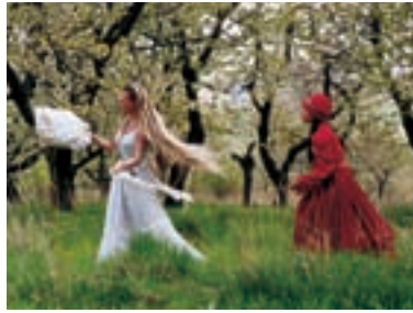
59. Kytice Wild Flowers 2000