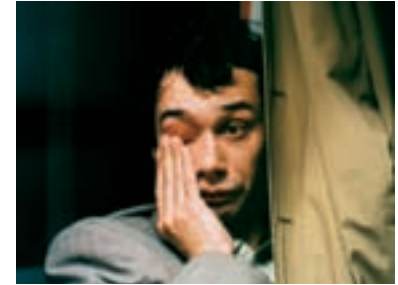
75. Návrat idiota 1999 The Return of the Idiot