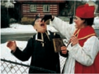
10. Bitva o život Battle for Life