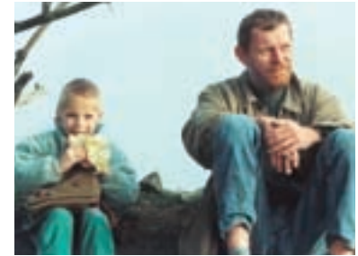
60. Lesní chodci Forest Walkers 2003