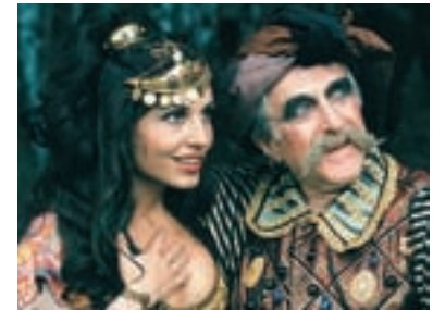
81. O perlové panně 1997 The Pearl Maiden