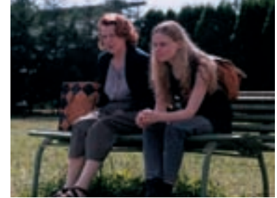
30. Ene bene Eeny Meeny 2000