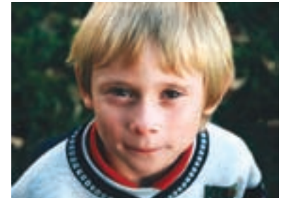
108. Smradi Brats