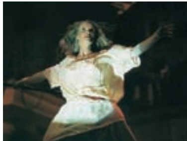
26. Don Gio Don Gio 1992