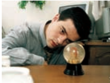
122. Začátek světa The Beginning of the World 2000