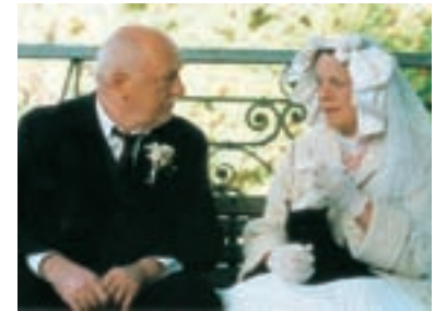
18. Co chytneš v žitě In the Rye