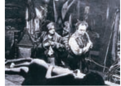
57. Krvavý román A Sanguinary Novel 1992