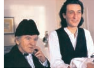
6. ... ani smrt nebere Where Even Death Does Not Apply 1996