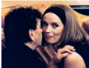
23. Díky za každé nové ráno Thanks for Every New Morning 1993