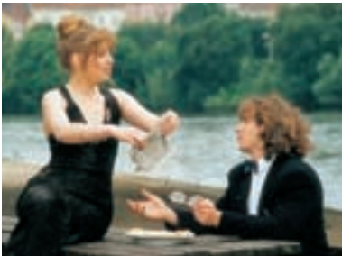
43. Jméno kódu Rubín Code Name Ruby 1996