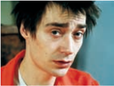
13. Cabriolet Cabriolet