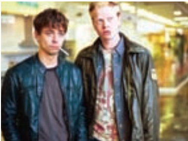
88. Perníková věž 2002 Coal Tower