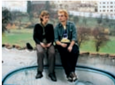
104. Samotáři The Loners