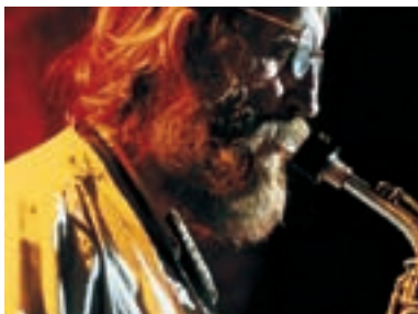
112. The Plastic People of the Universe The Plastic People of the Universe