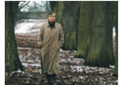
90. Podzimní návrat 2001 Returning in Autumn