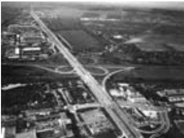
79. Nonstop 2000 Nonstop