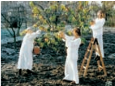
70. Modré z nebe Blue Heaven 1997