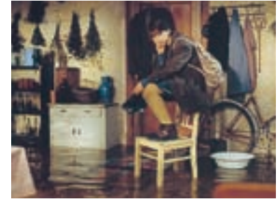
84. Orbis pictus 1997 Orbis Pictus