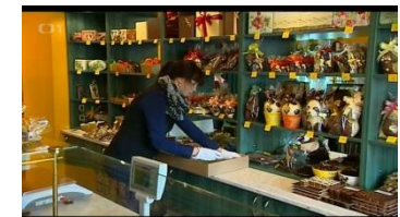
Scéna 5: „...zákazníci této ostravské prodejny...“