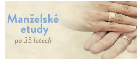
Manželské etudy po 35 letech (2018)